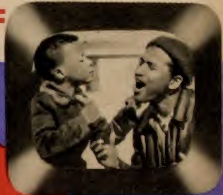
O Wunder! Das deutsche Fernsehen überträgt einen Boxkampf. Allerdings wird Sugar Ray Robinson da mehr einzustechen haben als hier von seinem Sohn. (S. 18 u. 20)